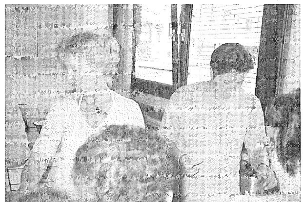
図4 セミナー農民女性

このようなことから、女性の意識改革や地位向上のためには女性個人の努力もさることながら、行政の支援や枠づくりが重要な役割を果たしていることがわかる。