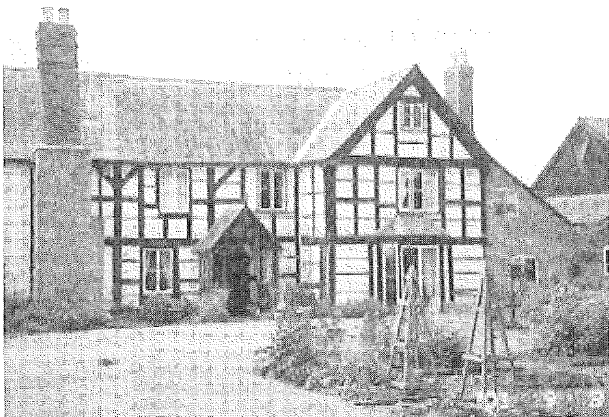
図3 イギリスの農家民宿と室内の様子

イギリスでは数件の農家レストランで食事する機会があった。狂牛病の影響で牛肉はほとんど出されなかったが、食事はもちろん清潔感溢れた店の雰囲気も、接客して下さった農家の女性たちの印象もとても良く、楽しい時間を過ごすことが出来た。