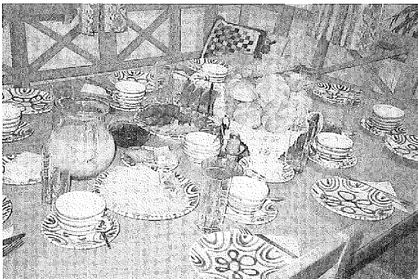
図1 農家民宿の食卓